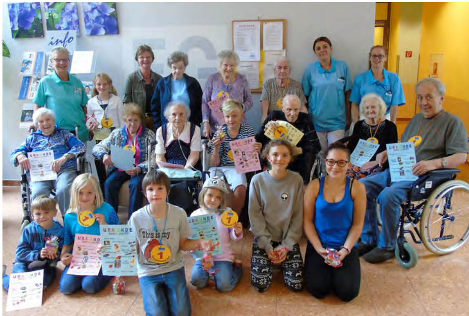
Die fleißigen Olympionikinnen und Olympioniken präsentieren stolz ihre Urkunden.