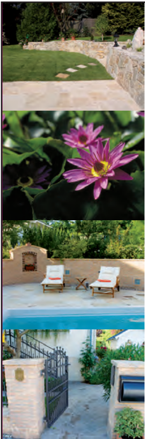
Design: Grafikstudio Sacher, Wien